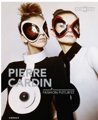
PIERRE CARDIN Fashion Futurist